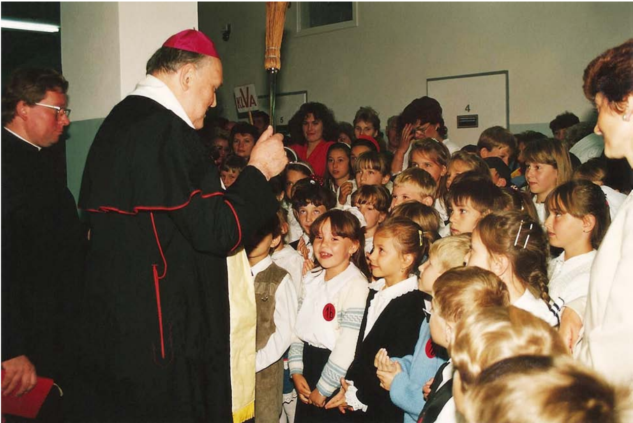
1993r. – Poświęcenie „Czwórki” przez biskupa Tadeusza Rybaka