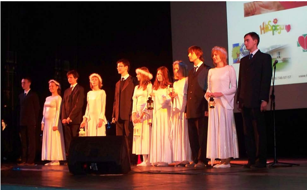
2009r. – Szkolny Teatr Poezji