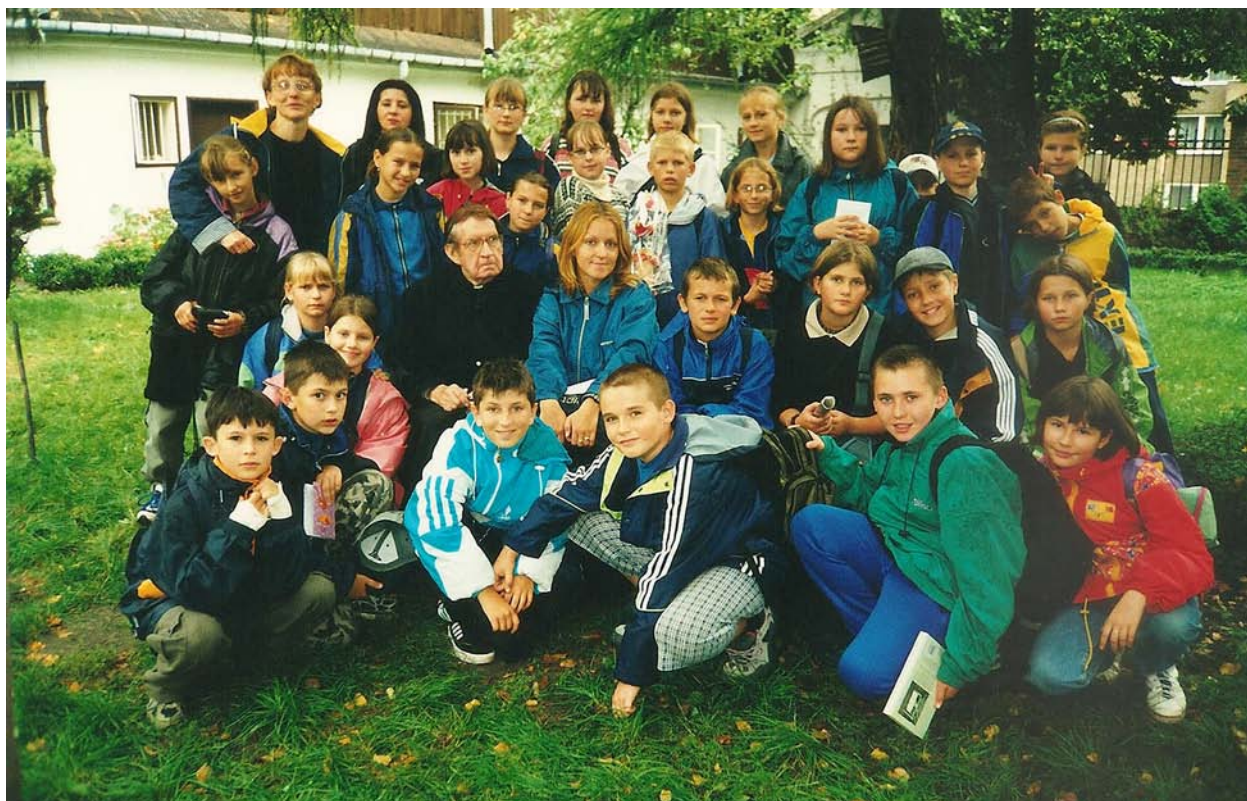
2000r. – Uczniowie z wizytą u ks. Jana Twardowskiego