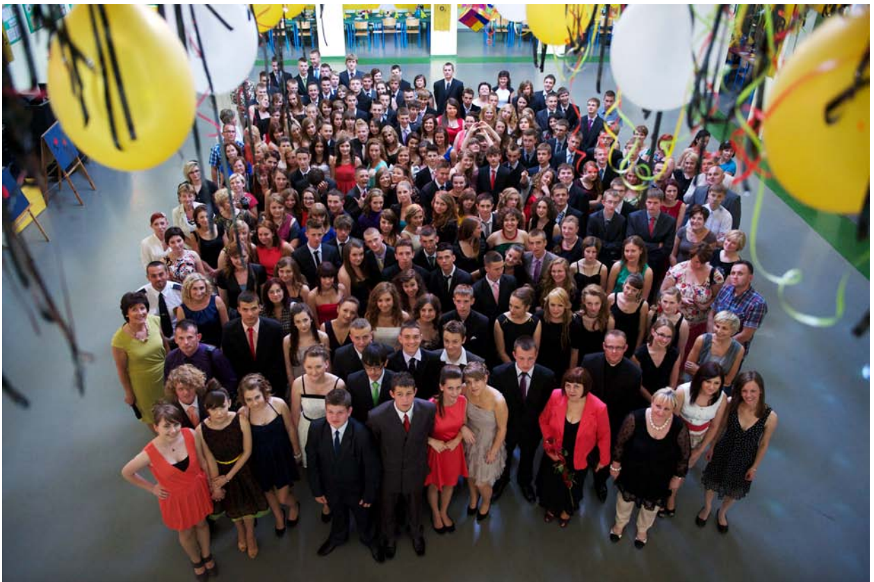
2012r. – Bal gimnazjalisty