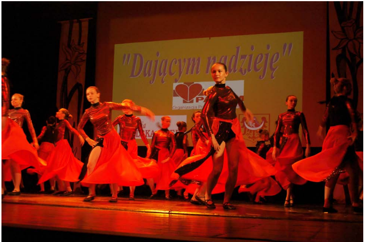
Zespół Piosenki i Tańca „Gwarkowie”