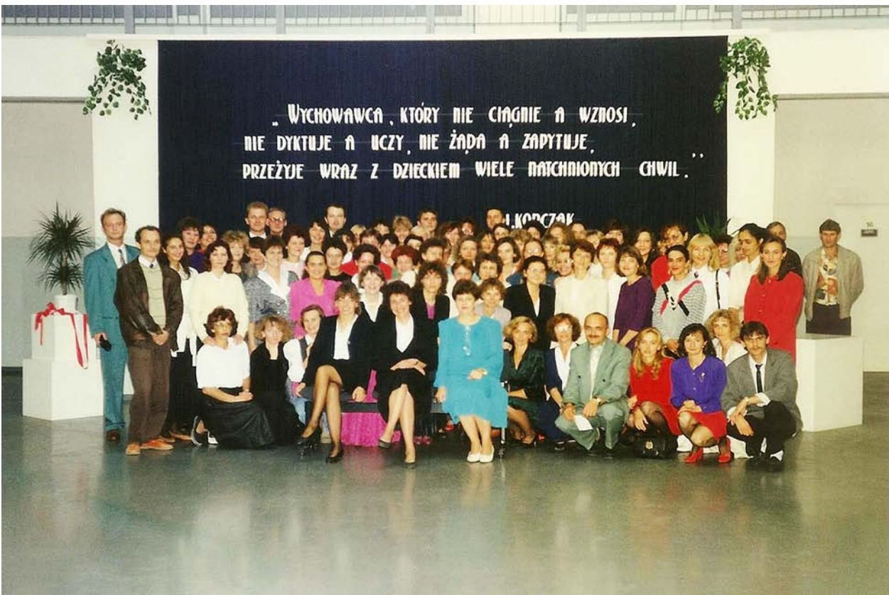
1993r. – Grono Pedagogiczne i pracownicy „Czwórki”