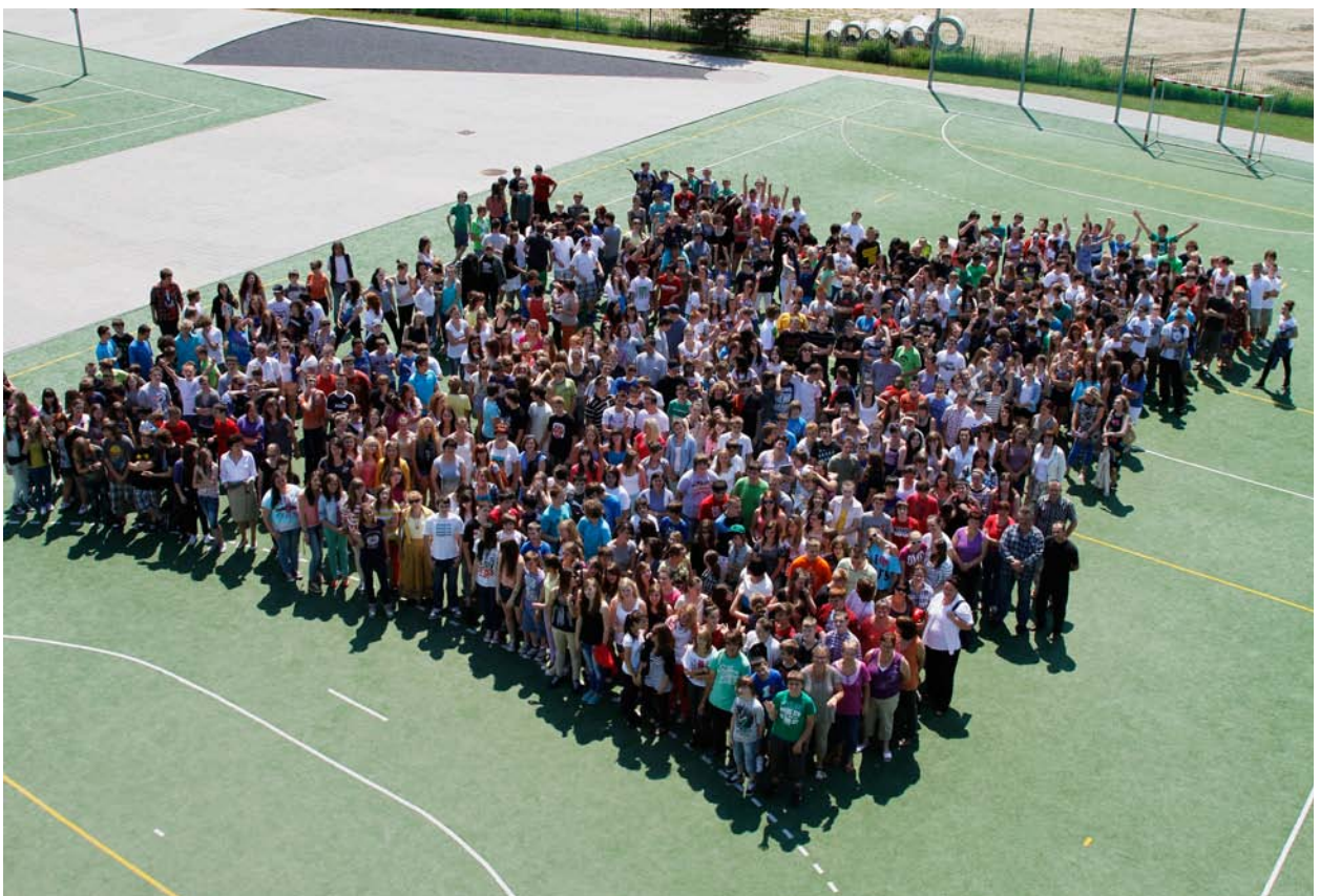
2012r. – Rok szkolny 2011/2012 uczniowie, nauczyciele i pracownicy szkoły