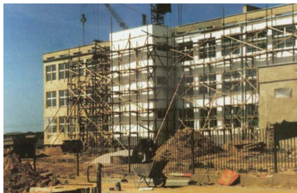
1993r. – budowa „Czwórki”

I...zamykam oczy, niech dalej snują się wspomnienia.