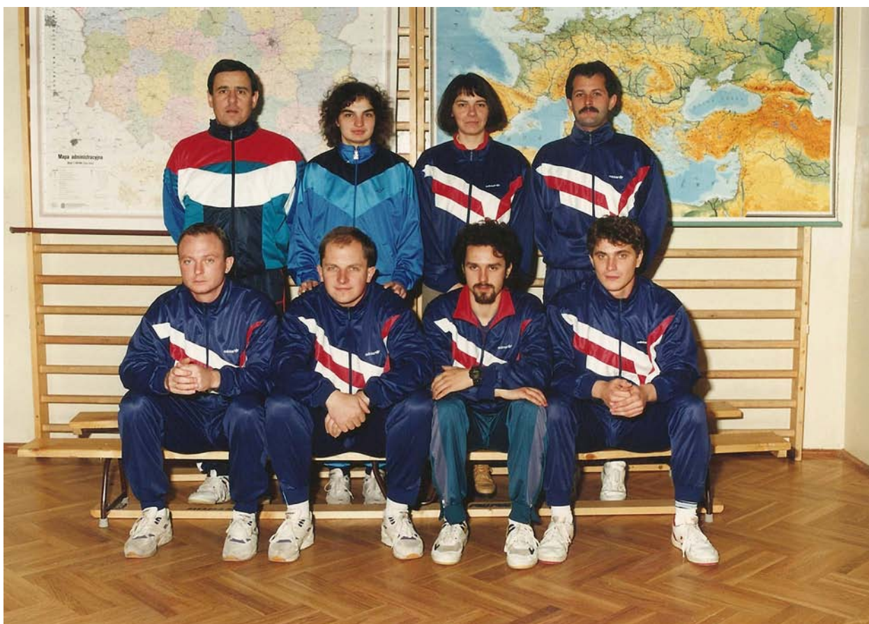
1994r. – Nauczyciele wychowania fizycznego