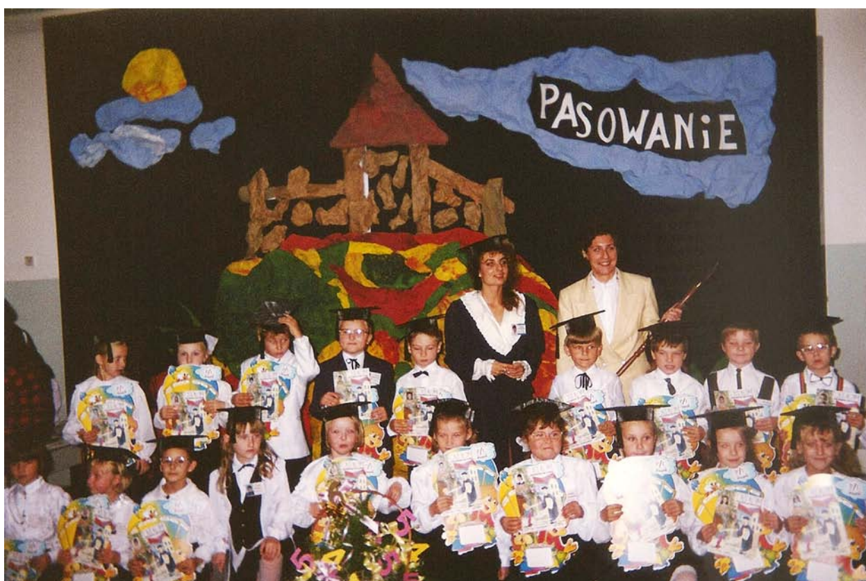
1994r. – Pasowanie na ucznia „Czwórki”