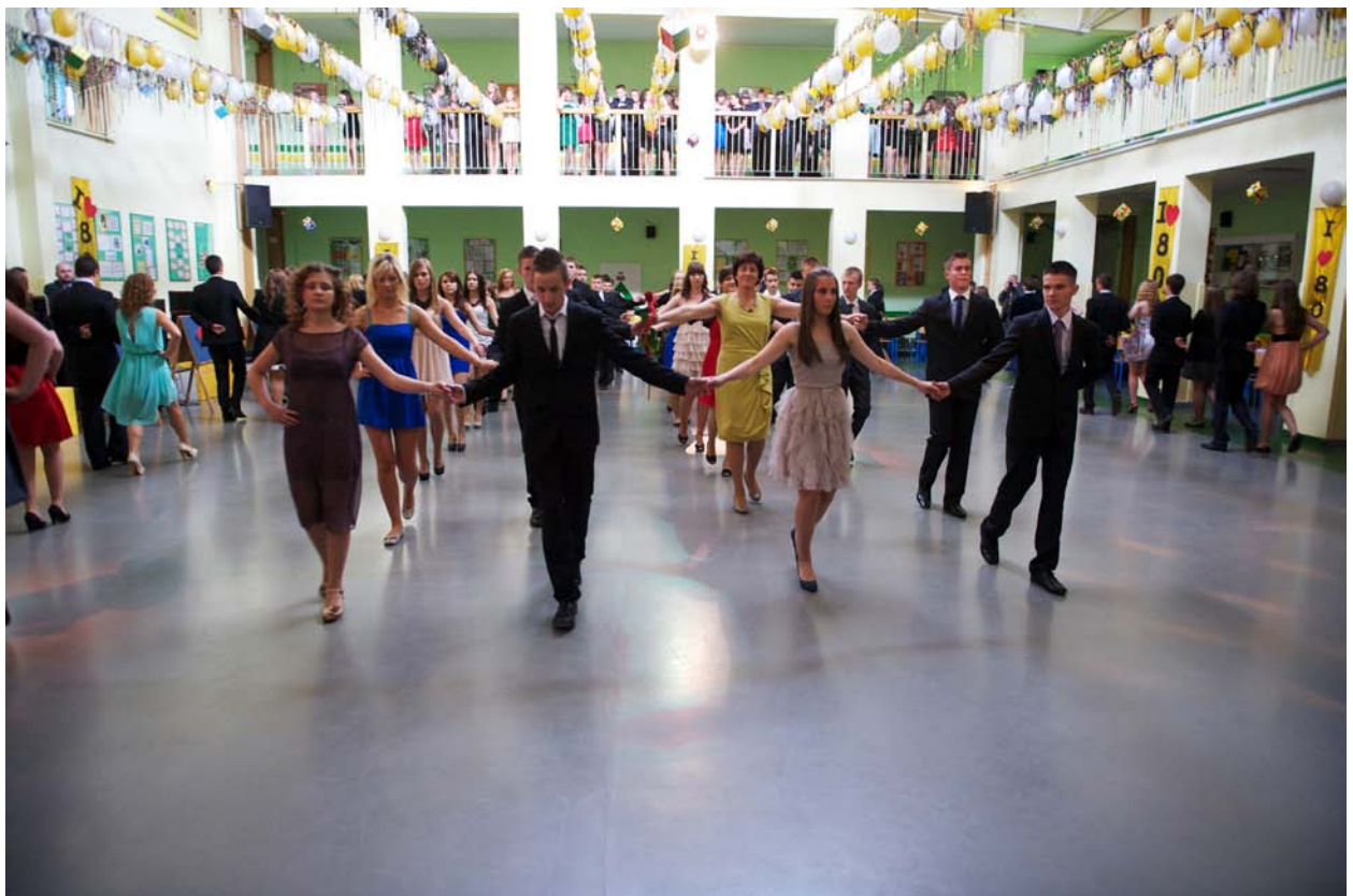
2012r. – Bal gimnazjalisty