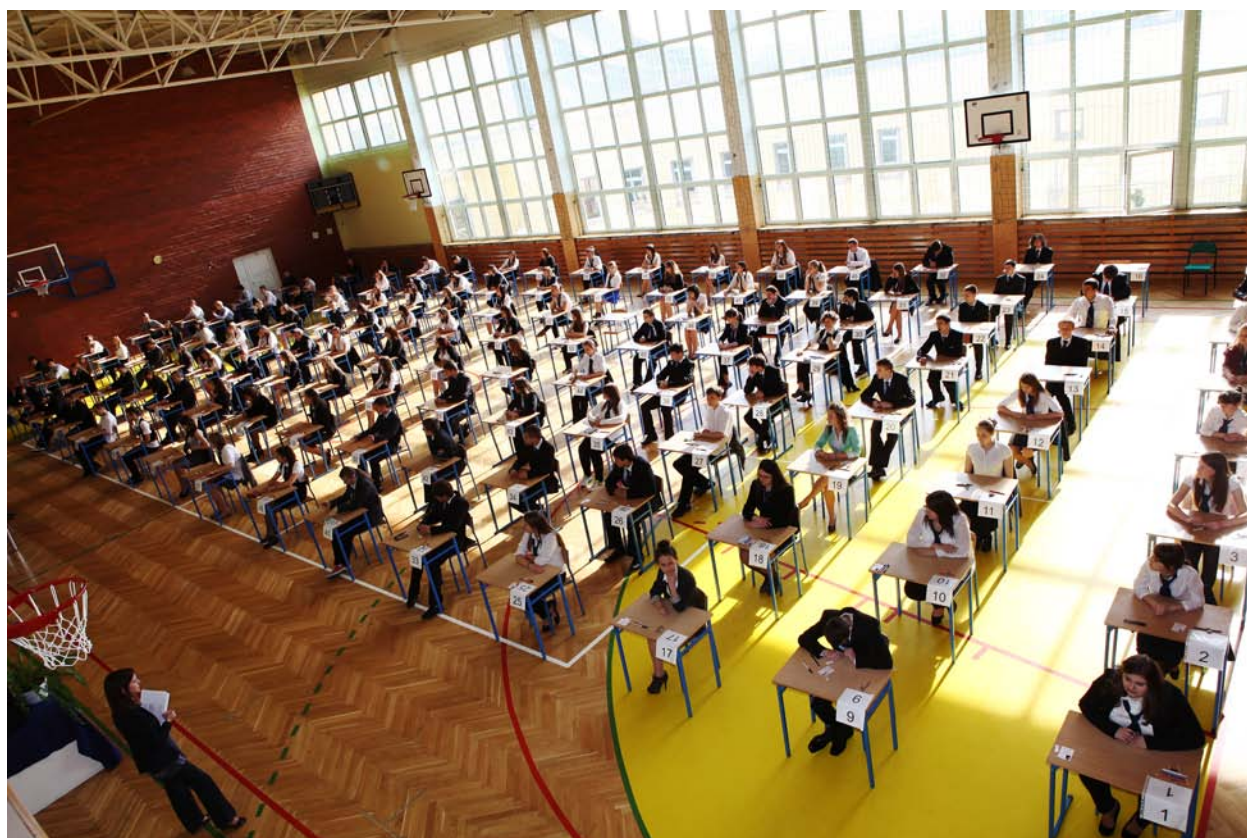
2012r. – Egzamin gimnazjalny