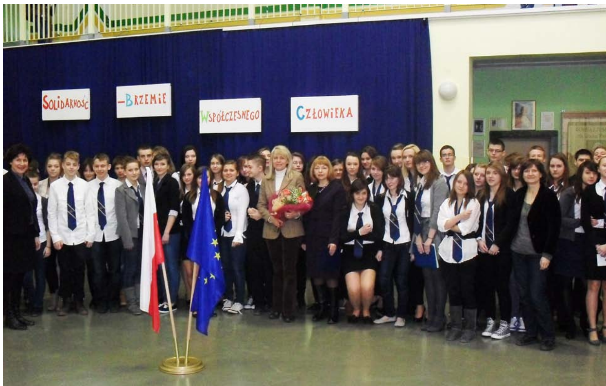
2012r. – Debata wolontariuszy z Posel do Parlamentu Europejskiego Lidią Geringer de Oedenberg