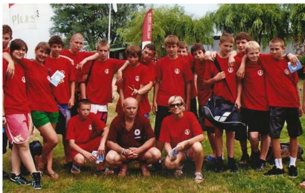
2010r. – Praktyczny egzamin uczniów na ratownika WOPR