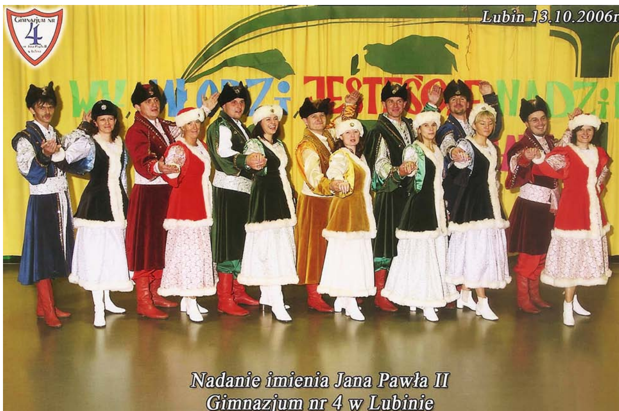
2006r. – Grono pedagogiczne