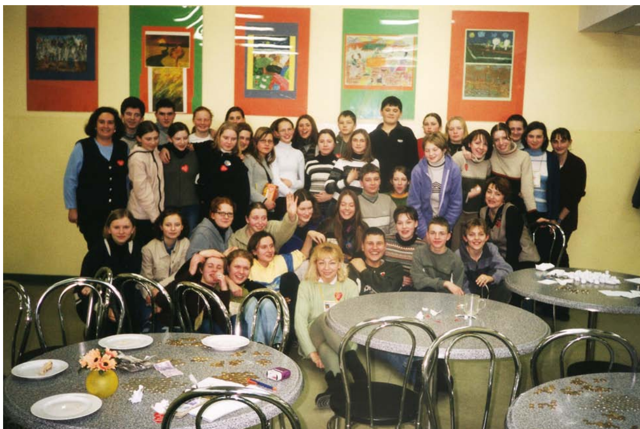
Wolontariat – Sztab Wielkiej Orkiestry Świątecznej pomocy